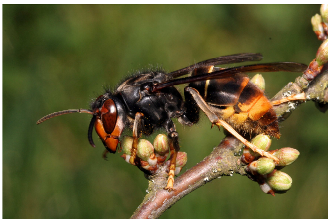
V. velutina sur un rameau en bourgeons.

Jean Haxaire, spécialiste de Lépidoptères Sphingidés attaché au Muséum, à qui J-P Bouguet transmet sa capture, identifie facilement l'insecte à partir de photos trouvées sur Internet. Des spécialistes de Montpellier confirment la détermination : le Frelon asiatique, Vespa velutina , a bel et bien été introduit en France.