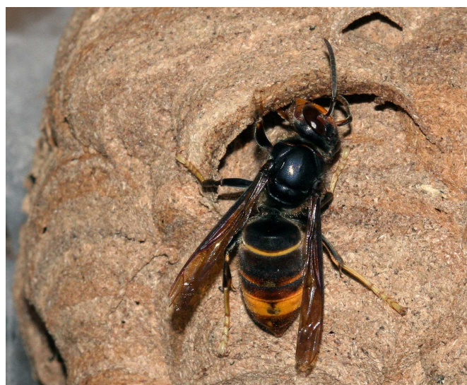
V. velutina nigrithorax construisant son nid.

Le nid du frelon à pattes jaunes est lui aussi facile à reconnaître. Lorsqu'il s'installe dans un espace bien dégagé (habitation, arbre au port étalé), le Frelon asiatique est un artiste qui façonne un magnifique nid de papier dont la forme, quasiment circulaire, est très caractéristique. La