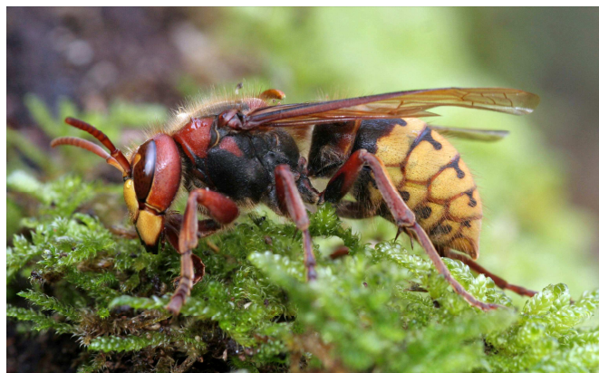
Vespa crabro , le frelon européen. Ici une fondatrice.

Les pattes sont jaunes à l'extrémité. La tête est noire et la face jaune orangé.