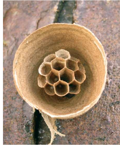
Nid de V. velutina lors de la fondation d'une nouvelle colonie au printemps.

limiter son impact sur la biodiversité et l'activité apicole. Le Frelon asiatique apparaît comme une menace pour l'apiculture, surtout en zone urbanisée, mais aussi pour la biodiversité, notamment celle des insectes pollinisateurs. Cette menace intervient de façon directe, du fait de l'énorme pression de prédation que cette espèce exerce sur les insectes, mais aussi de façon indirecte à cause de l'impact négatif des campagnes incontrôlées de piégeage massif et de la destruction des nids. Les pièges à appâts tuent en effet d'innombrables espèces « non-cibles », notamment les guêpes communes, le frelon d'Europe, des mouches ou de nombreux papillons, tandis que les nids traités à l'insecticide et laissés en place menacent l'avifaune qui se nourrit de larves des colonies empoisonnées. L'utilisation de pièges attractifs spécifiques qui permettraient une protection des ruchers est en cours d'étude.