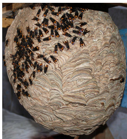
Nid photographié à Sergeac (Dordogne) en novembre 2008.

Le nid du frelon à pattes jaunes est lui aussi facile à reconnaître. Lorsqu'il s'installe dans un espace bien dégagé (habitation, arbre au port étalé), le Frelon asiatique est un artiste qui façonne un magnifique nid de papier dont la forme, quasiment circulaire, est très caractéristique. La