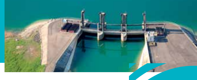
Déversoir d'extrémité du canal d'aménée Seine

En été et en automne, l'eau précédemment stockée dans le lac-réservoir est restituée à l'aval pour éviter un débit trop faible et permettre notamment les prélèvements pour